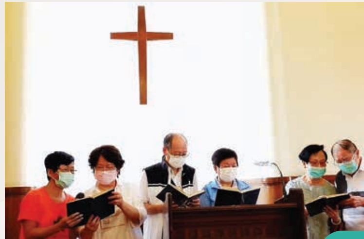
▲ 查經班學員分享詩歌