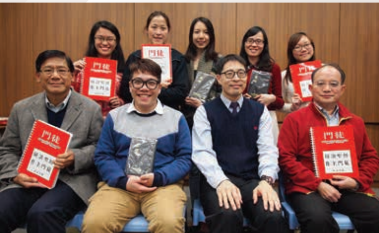
▲ 2016年紅色門徒導師和組員

(筆者於2013年在九龍堂洗禮，是青年團契團友，分別於2016年和2020年完成紅色及綠色門徒課程，現為少年團契團長。)