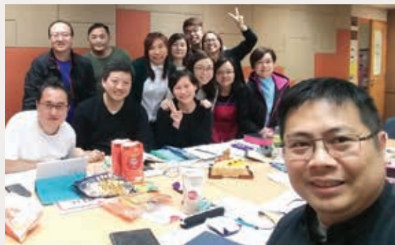
▲ 初任紅色門徒助教，與學員導師合照