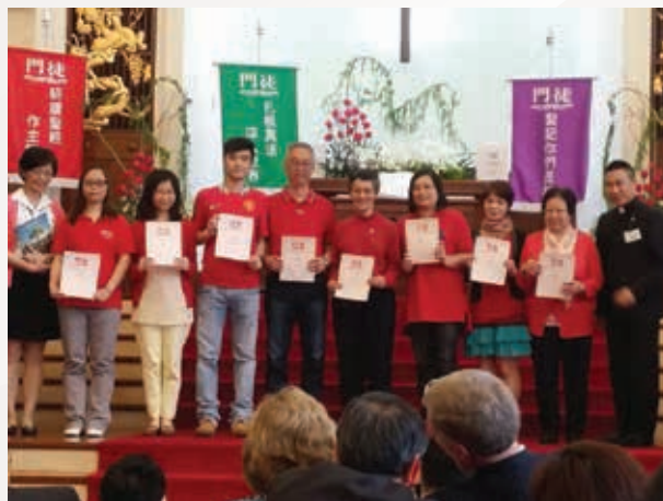
▲ 紅色門徒畢業禮 (2013年)