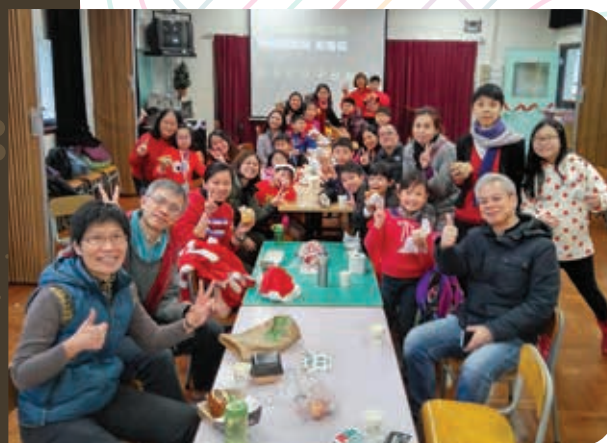
▲ 探訪護老院前留影