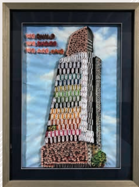
彩色捲紙拼湊的衛斯理大樓 ▶

近年，我們在暑假也安排特別活動，其中包括回溯循道衛理在香港的故事，家居強健體能運動，學習彩色捲紙藝術等。另外，我們也會集腋成裘，將弟兄姊妹的小小金錢奉獻交給九龍堂或別的堂會作重建之用。