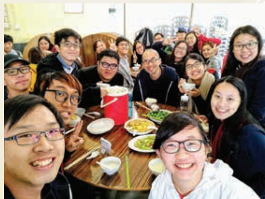
▲ 大專基督徒讀經營

多年的聖經學習，讓我深深體會到，聖經是教會的根本，教會因聆聽聖經而生、而存在。世界急變，潮流一浪接一浪。信徒以至教會要站立得穩，最重要是抓緊上帝的話。對上帝話語的詮釋，聖經對當下的意義，卻需要一代一代人，每個信徒認真地立於自己的年代，繼續努力研究反思，才能「到地」和活現當下，這不是人家現成製作的課程所能取代。