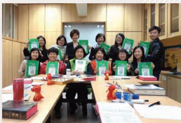
▲ 綠色門徒學員與導師合照 (2018年)