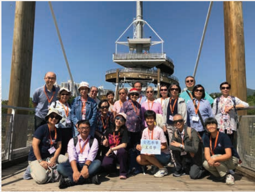
▲ 2018年遊覽大埔海濱公園