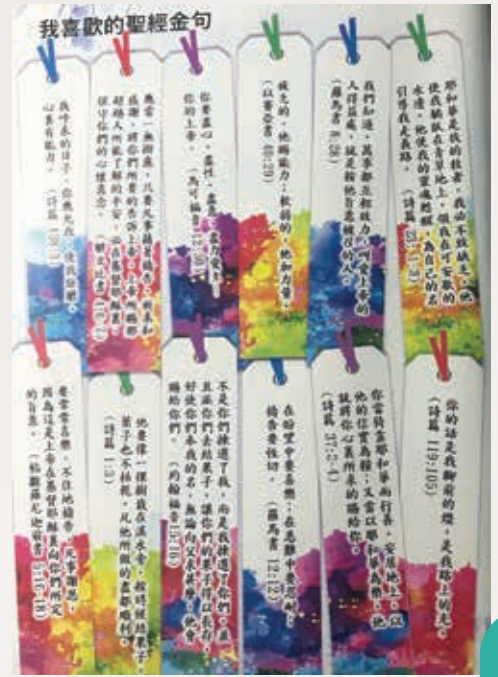
▲ 同學最喜愛的金句