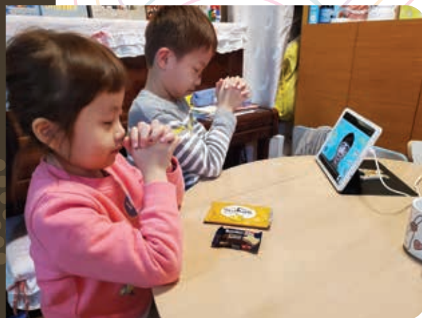
▲ 疫情期間的網上主日學

孩子這些反應，令我有喜也有憂。喜，是因為「耶穌」這個名字和他的基本工作已經深深印在孩子的腦袋中，相信到老也難以忘記。憂，固然是我們所傳遞的信仰，恐怕會僵化成為簡單的「標準答案」，而未能成為孩子生命的一部分，無法在面對的處境中作出門徒的價值判斷和行動。雖然「培育孩童作主門徒」這個目標聽起來既艱難又深遠，但我確信這是主所託付和應許的，必能成就：「使萬民作我的門徒，奉父、子、聖靈的名給他們施洗，凡我所吩咐你們的，都教導他們遵守。」（馬太福音 28:19-20）