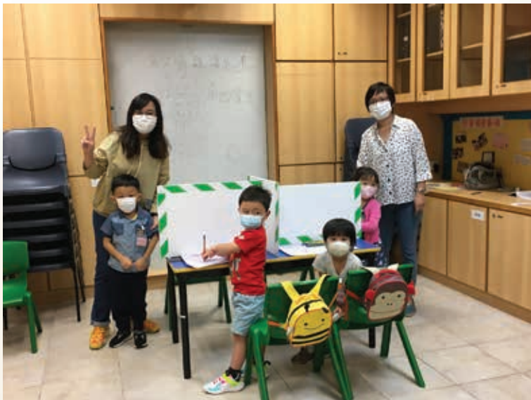
▲ 疫情下K2上課加強防疫