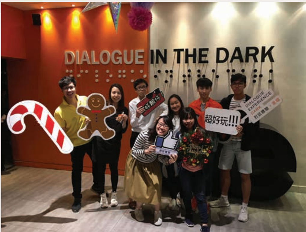
▲ 2017年少年級主日學戶外活動

智慧文學、教會書信及啟示文學的基礎。另一方面，每一節課堂都會提供教案給導師，當中包括經卷背景、寫作目的等，亦有教學活動建議、教學重點及討論問題。另外，設有集體備課環節，以支援導師教學。