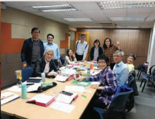
▲ 2020年綠色門徒導師和組員