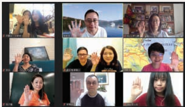
▲ 任教紅色門徒課程 (2020-2021年度)

我和「門徒」的相遇是在1996年，那時參加九龍堂第二屆紅色門徒課程，現在是紅色門徒課程的導師。從學員到導師，我在這二十多年時間已經閱讀多次課程內容，但是每次隨着人生轉變，都體會到不同的生命挑戰。現在我回看當年所做的筆記，縱然記錄自己對聖經的理解是如何表面，所發現的是如何無知，所反省的是如何愚昧，這些都是我信仰的一部分，更是我和上帝所經歷的生命旅程。感謝上帝讓我真正體驗他的臨在！更感謝上帝讓我真正體會聖經的真實！