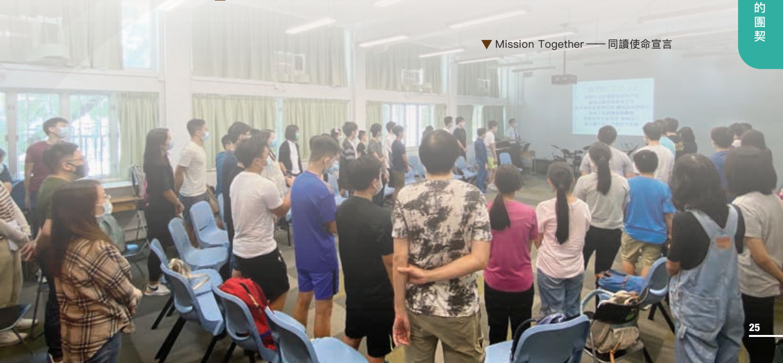
▼ Mission Together——同讀使命宣言

(筆者於 2007 年加入九龍堂，現為 Youth Zone 區長及中一級導師。)