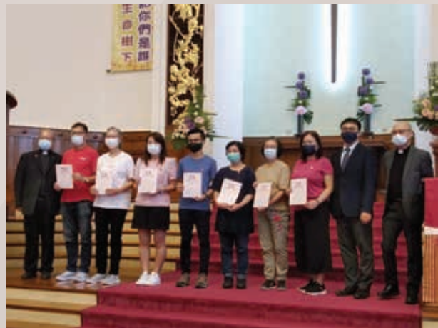
▲ 紅色門徒畢業禮（攝於2020年）

（筆者於2002年在九龍堂進行堅信禮，現時參加查理士團契，並在 Youth Zone 少年特區中二組擔任導師。）